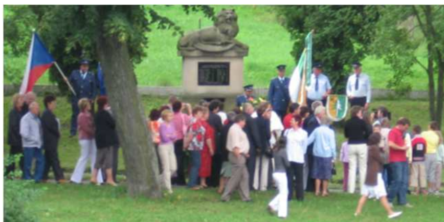
Svěcení obecního praporu 2006

Pokud bude zájem z řad členů SDH i dalších občanů, bude se sbor snažit zajistit slibovaný zájezd.