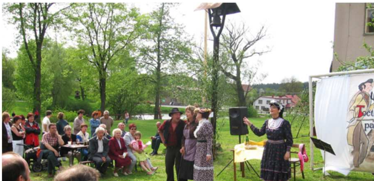
kácení máje 2006